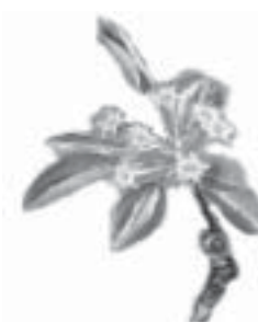
6-Caída de pétalos