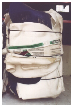
Fardo de envases