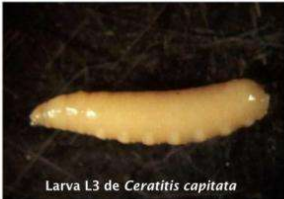
Larva L3 de Ceratitidis capitata