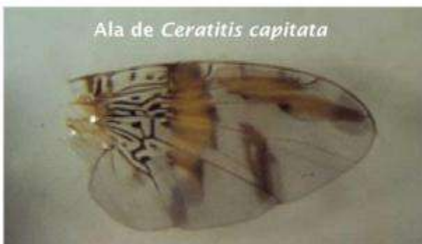
Ala de Ceratitidis capitata

Presenta un solo par de alas membranosas, con 3 bandas de color amarillo-anaranjado y marrones, formando el característico patron alar semejando al símbolo de matemática.