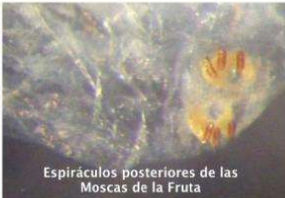
Espiráculos posteriores de las Moscas de la Fruta

disposición en el espiráculo son elementos importantes al momento de la identificación de especies.